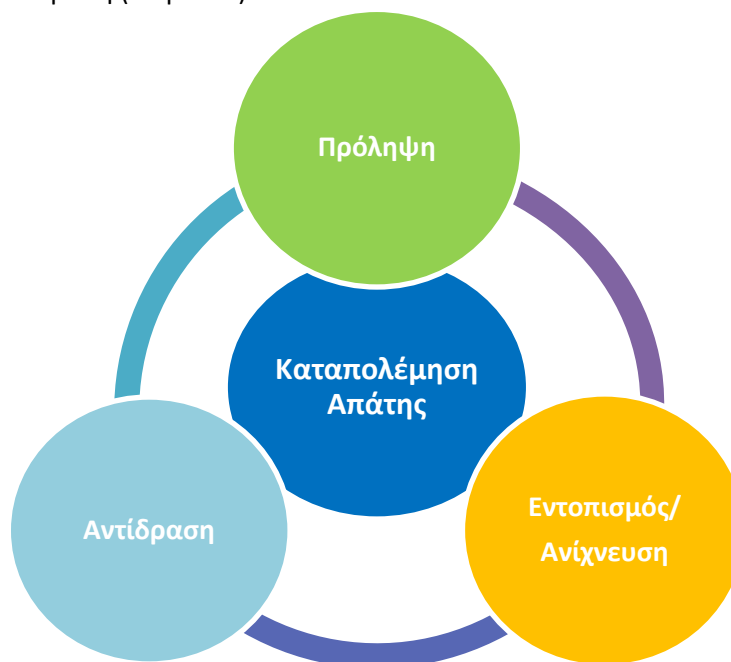
Σχήμα 1. Άξονες της Στρατηγικής Καταπολέμησης της Απάτης

Η εν λόγω Στρατηγική, ως αποτυπώνεται στο Σχήμα 1 που ακολουθεί, καλύπτει όλα τα στάδια του κύκλου καταπολέμησης της απάτης, ήτοι την πρόληψη (prevention), την ανίχνευση/εντοπισμό (detection) και την αντίδραση (response).